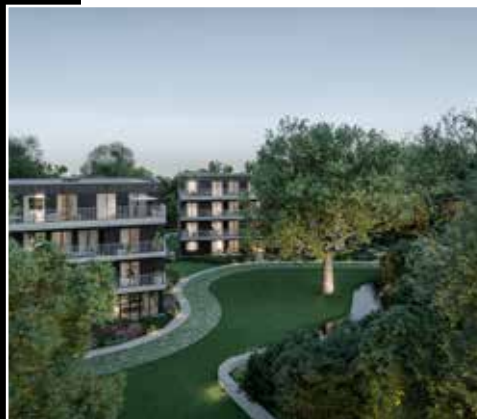
Oak Park - St-Amandsberg - Gand

Chaque jour, nous parvenons à mettre en place ces objectifs grâce à notre équipe passionnée et expérimentée.