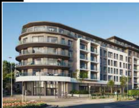
Vancouver - Woluwé-Saint-Lambert