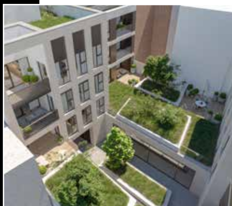
D'Oude Vesting - Courtrai