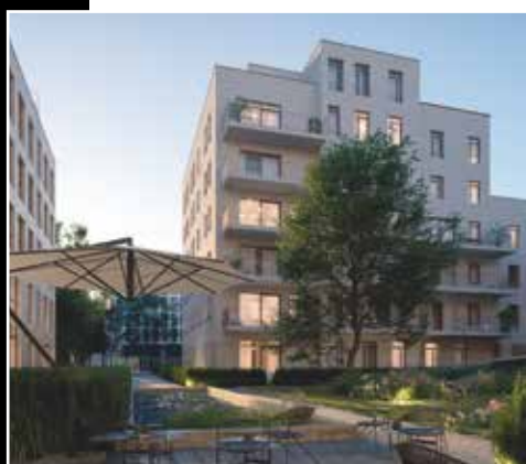
Grand Yard - Anvers